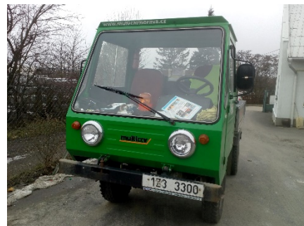
Multicar – k prodeji nabízí technické služby