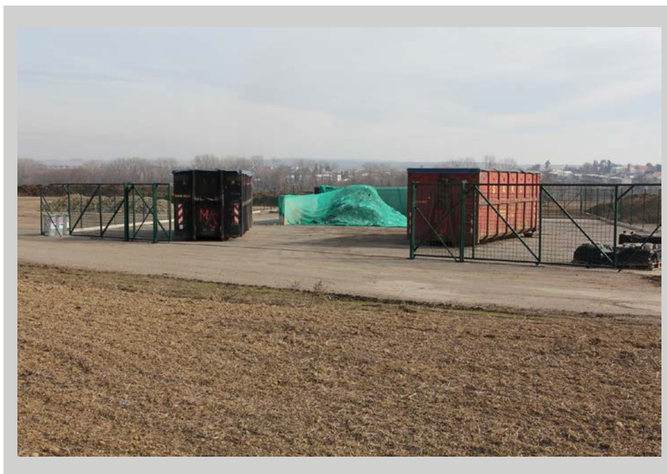
Překladiště SKO Morkovice

V rámci projektu je členským obcím DSO nabízeno několik okruhů podpůrných a poradenských činností, které mohou dle zájmu či aktuální potřeby využívat. Jedná se rámcově o tyto tematické oblasti činností: sdílená administrativní kapacita, poradenství v oblastech dle preferencí členských obcí, vzdělávací aktivity: školení pro představitele obcí a zaměstnance obecních úřadů, zprostředkování právní podpory mezi obcemi, SMO ČR a spolupracující právní kanceláři, dotační poradenství a činnosti související s předložením individuálních projektů.